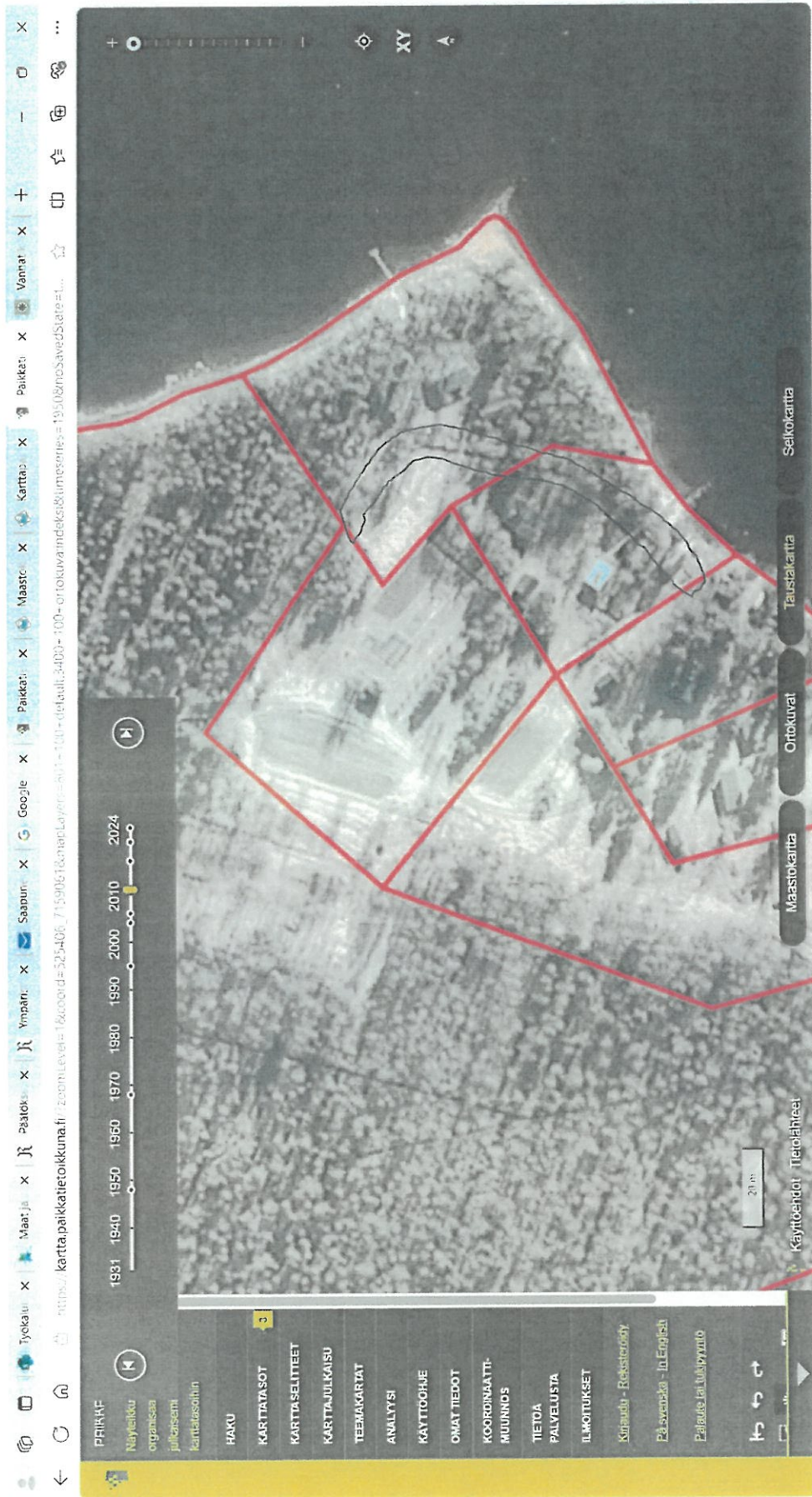
Kuva 2. Vuoden 2011 ilmakuvassa ojan sijainti ympyröity kiinteistöjen 976-406-53-39 ja 976-406-53-28 alueella.