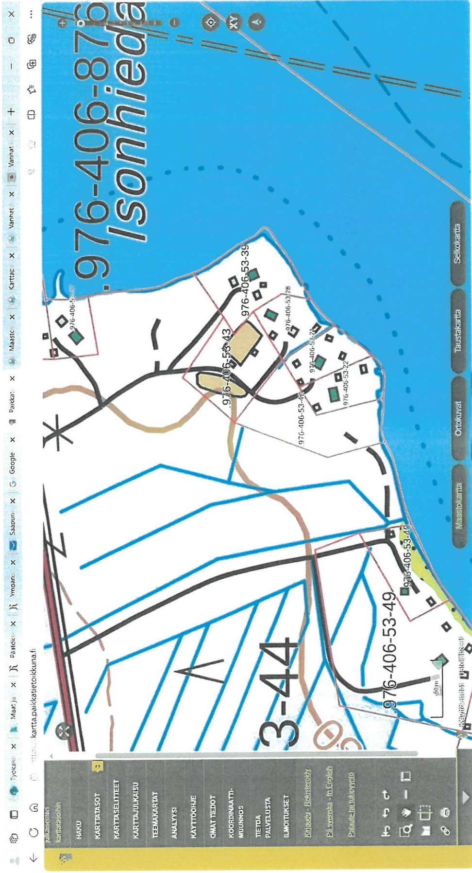
Kuva 1. Paikkatietokunnasta otettu kartta, josta näkyvät kiinteistöjen rajat ja kiinteistönnumerot.